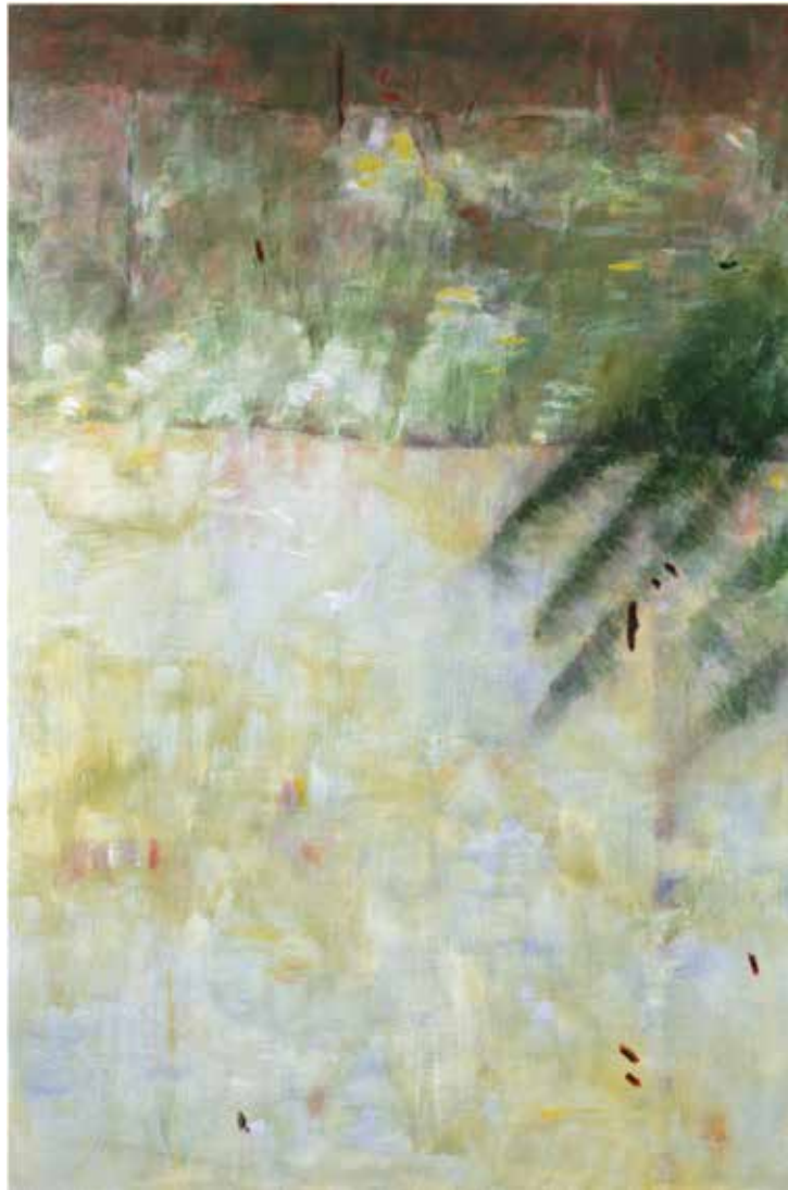
Paysage décalé 3, 195 x 130 cm – peinture acrylique sur toile, 2009