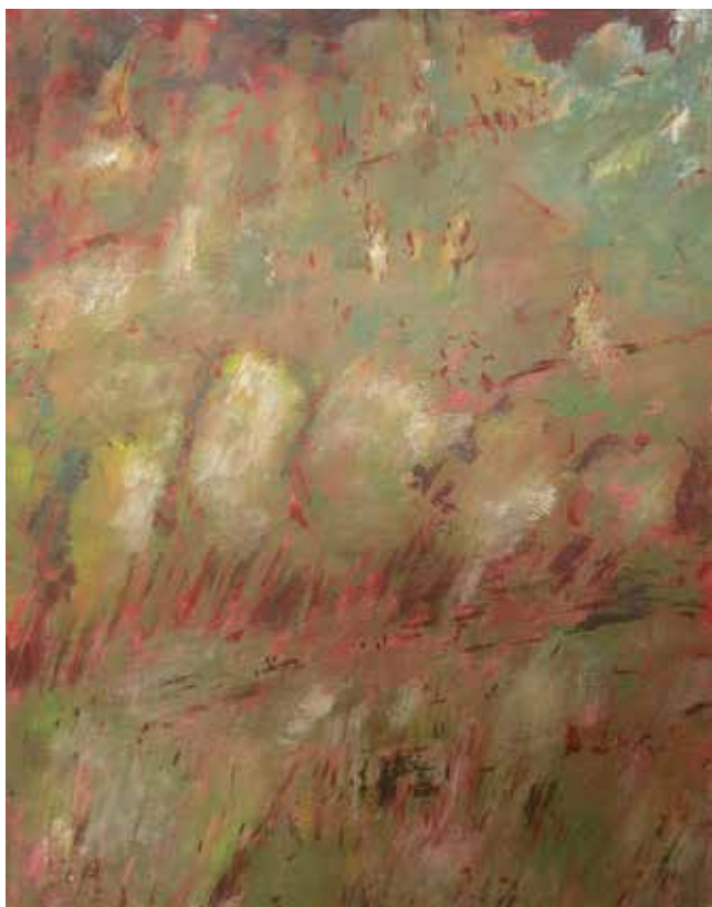
Arbre penché n° 2 , 30 x 24 cm – peinture acrylique sur bois, 2012-2013

Ce peintre et le paysage de mon enfance ont construit ma vocation et surtout le chemin dans lequel je me suis de plus en plus engagée. La lumière, les couleurs changeantes et nuancées, les libertés que je prends avec les médiums et les styles de représentation, l'envie de ne pas m'arrêter à une définition, d'embrasser plusieurs propositions, tout cela je le tiens de ces premières années pendant lesquelles ma perception du monde s'est développée. Mes premiers souvenirs de plaisir intense sont des lumières vibrantes sur le mur de ma chambre. J'en garde un souvenir indescriptible et magique.