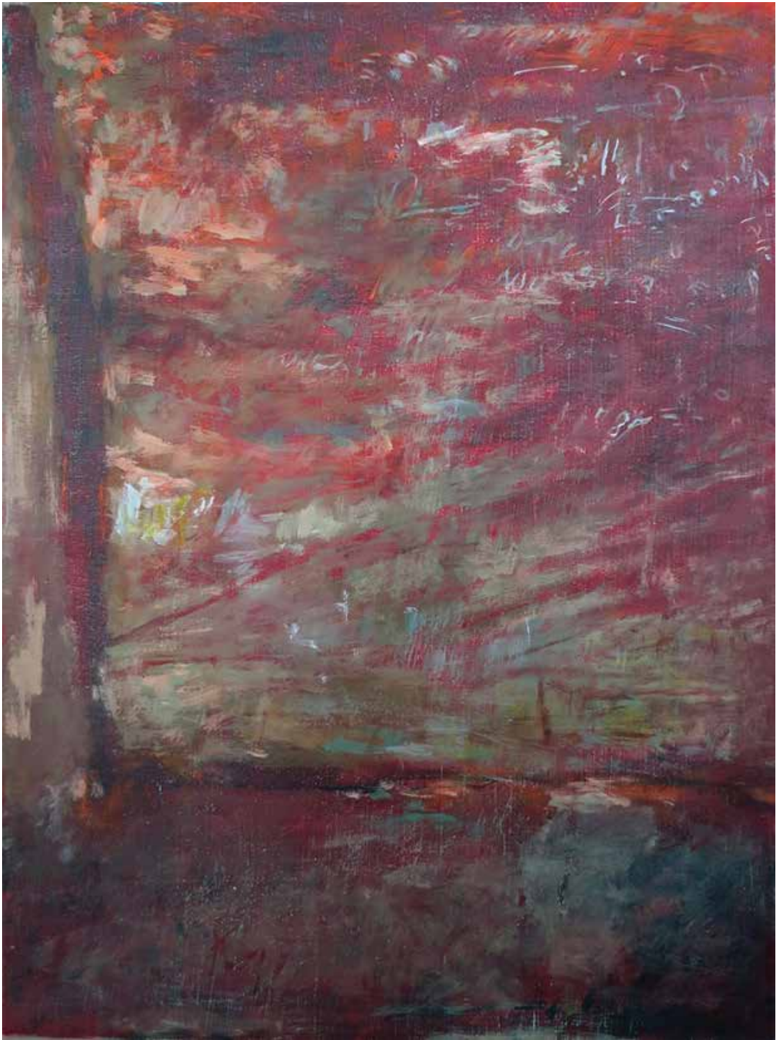
Arbre le soir , 40 x 30 cm – peinture acrylique sur bois, 2012-2013