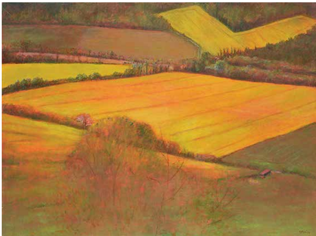
Cercle carré triangle, 97 x 130 cm – peinture acrylique sur toile, 2013