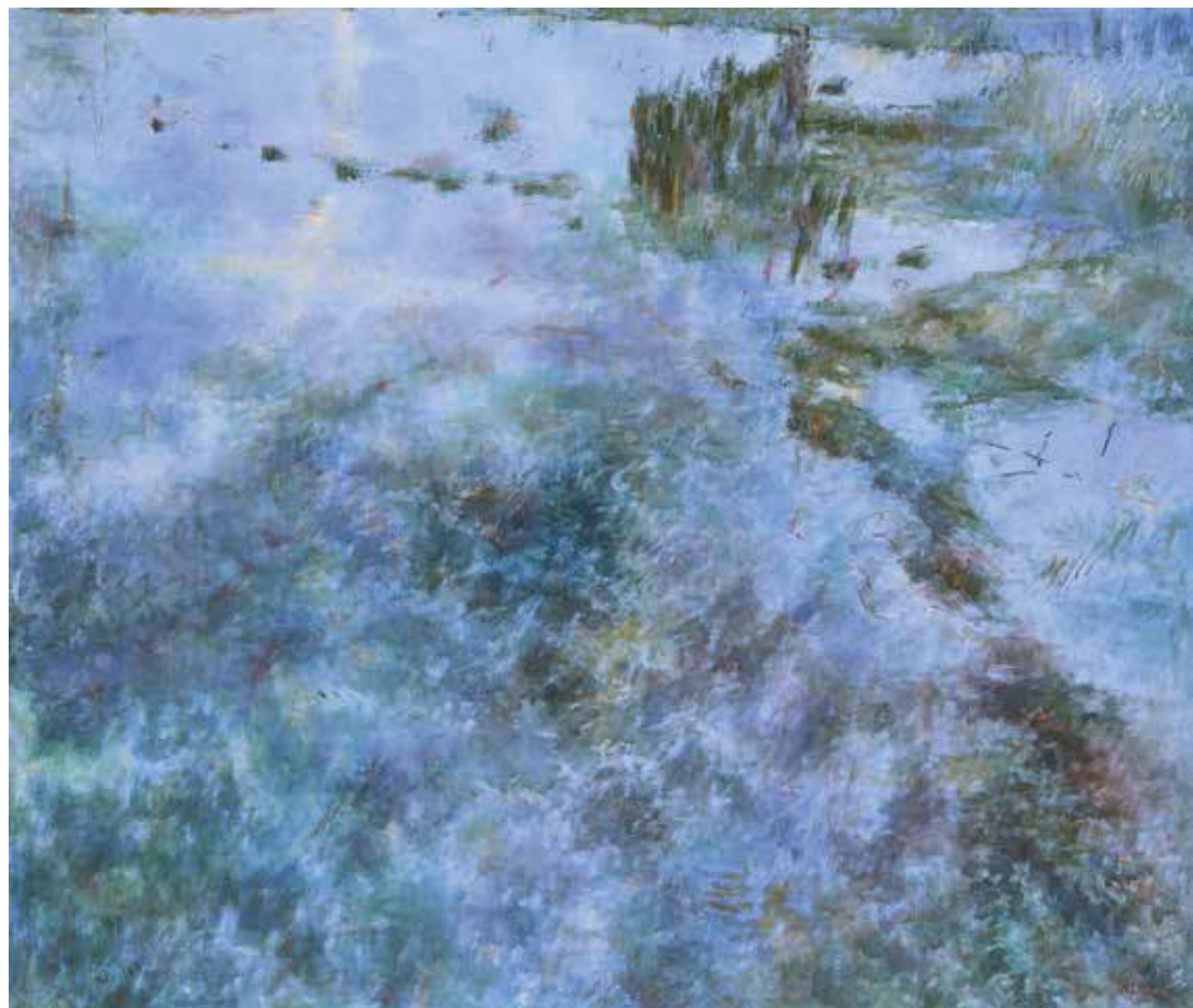
Eaux bleues , 110 x 130 cm – peinture acrylique sur toile, 2013

Au fil du temps, je m'aperçois que l'essentiel pour moi reste le plaisir visuel que me procure la contemplation de la lumière dans les différents éléments du paysage. Je cherche à fixer cette vision. J'ai utilisé la photographie, elle me sert encore pour capter ces moments précis, mais souvent elle ne me satisfait pas, elle ne me permet pas de transmettre l'émotion que j'éprouve. Pourtant le travail en laboratoire me procure la même fascination qu'en peinture. Sans doute la révélation de l'image, la recherche de