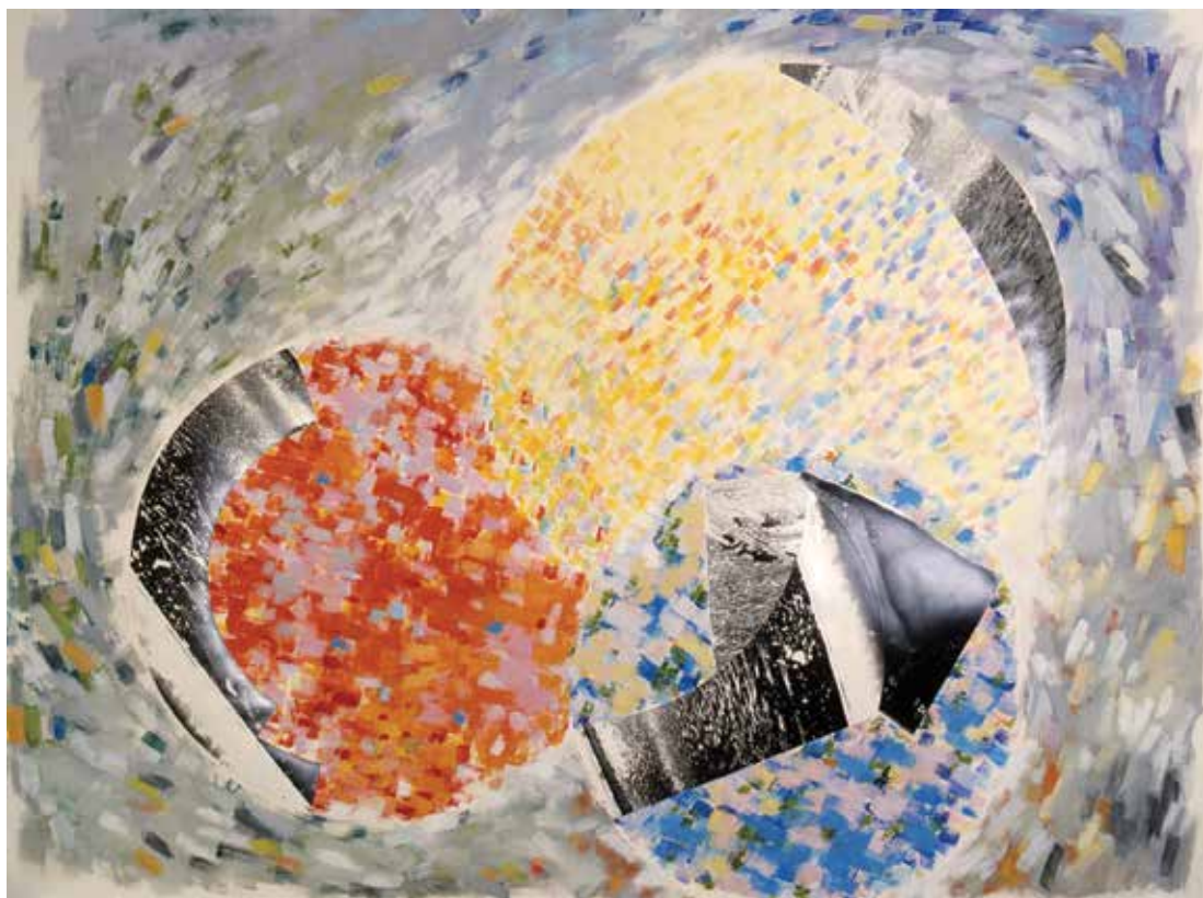
Eaux n° 17 , 125 x 160 cm – photographie-pigments et liant vinylique sur papier, 1985