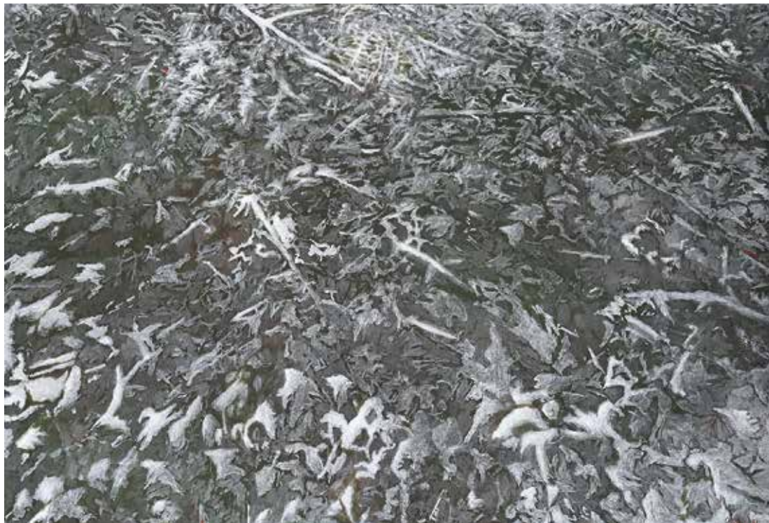
Sol enneigé n° 4, 89 x 130 cm – peinture acrylique sur toile, 2014

l'intensité des valeurs, la possibilité de laisser apparaître ou disparaître de la prise de vue ce que l'on désire, tout cela est proche de l'acte de peindre.