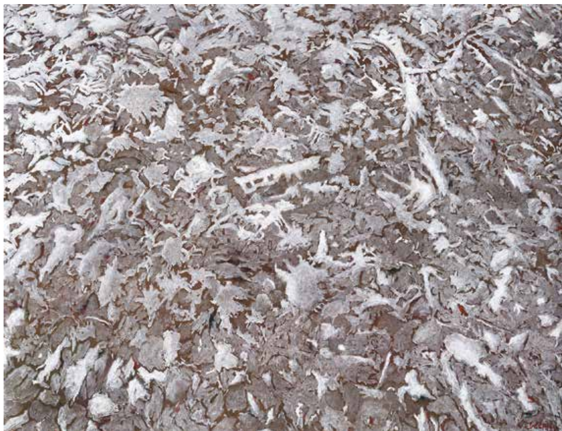
Sol enneigé n° 2, 89 x 116 cm – peinture acrylique sur toile, 2014

Dans les années quatre-vingts, j'ai écrit un texte m'expliquant à ce propos. En voici un passage extrait du catalogue de la galerie Keller en 1987 : « C'est à partir de photos, images d'une réalité visuelle – extérieure – et objective que se forme si l'on peut dire une visualisation – intérieure – subjective, que je dessine ou je peins. Cette peinture prend ses sources, découle de l'image réelle mais l'image réelle est une tyrannie dont je me dégage avec conscience et passion. »