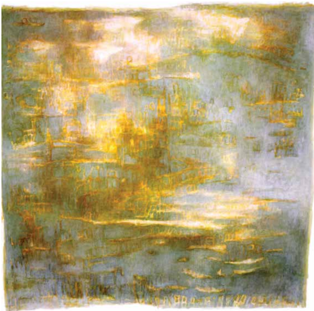
Chemin n° 5 , 100 x 100 cm – peinture acrylique sur toile, 1998-2000

3 Joan Mitchell (1925-1992) est une artiste-peintre américaine faisant partie du mouvement expressionniste abstrait dit de « seconde génération ». Elle développa une œuvre à la fois abstraite et expressionniste très puissante.