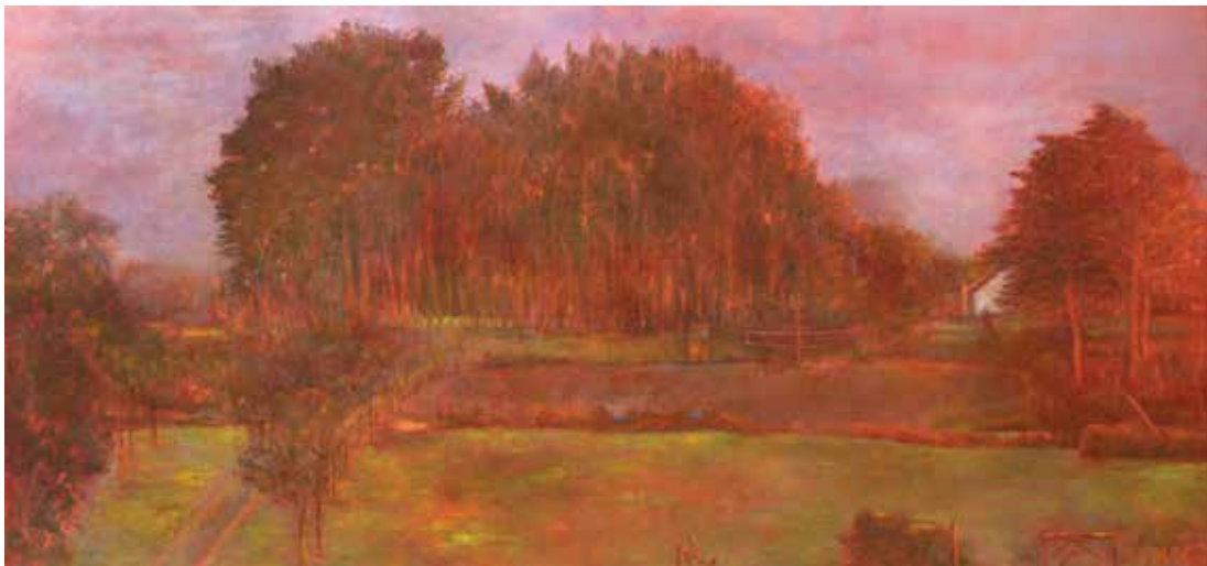
Paysage dans la brume n° 2, 70 x 150 cm – peinture acrylique sur toile, 2015

La peinture, qui m'oblige à construire, qui demande du temps, me donne le moyen d'exprimer la beauté et le mystère complexe que je ressens face à la contemplation du paysage. Toute ma vie, cet incessant parcours, rempli de nouveaux chemins, m'a menée au même but.